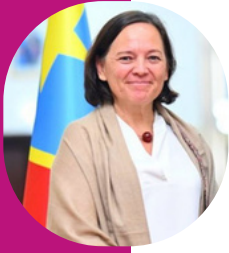
Roxane de Bilderling Ambassadeur de Belgique en RD Congo